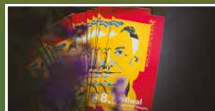
Festiwal Haupta za nami - s. 14