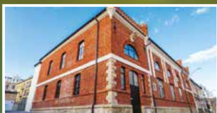
Sokół nagrodzony! - s.7