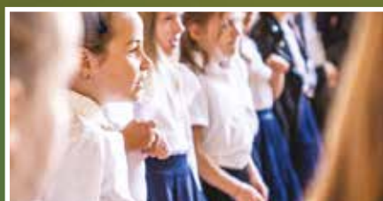
Pasowanie na uczniów - s.8