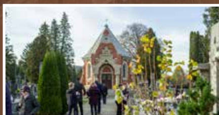
Wspominamy tych którzy odeszli - s.8