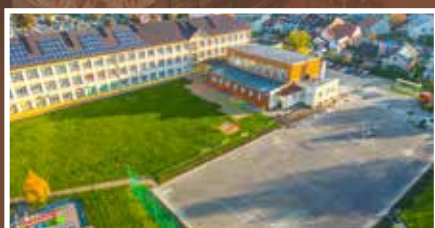
Zmieniamy boisko przy MZS nr 5 - s.6

NIEBEZPIECZNE ODPADY Z TERENU BYŁEJ RAFINERII USUNIĘTE!