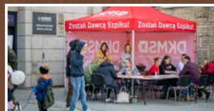
Gorliczanie pokazali wielkie serce - s. 15