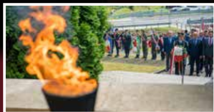
Mijają 84 lata od wybuchu II w.ś. - s.2