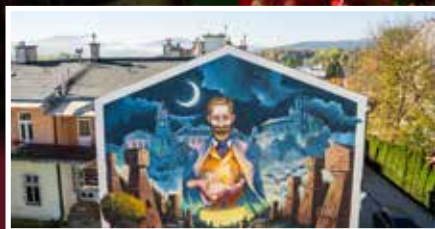
Mural z nagrodą - s.5