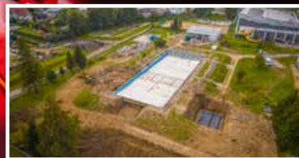
Zmienia się gorlickie kąpielisko - s. 7