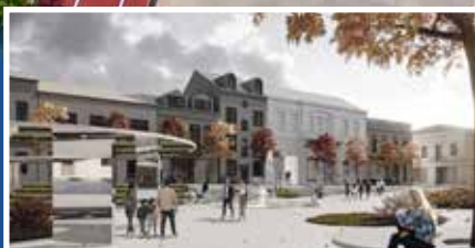
Historia światła jakiej jeszcze nie było - s.13