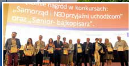
Gorlice przyjazne uchodźcom - s.2