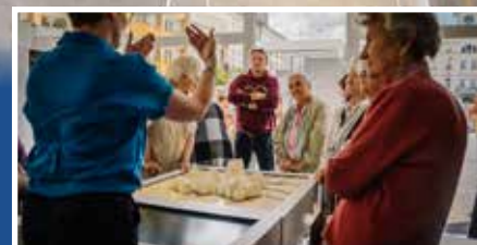
Muzeum na kółkach odwiedziło Gorlice po raz drugi - s. 6