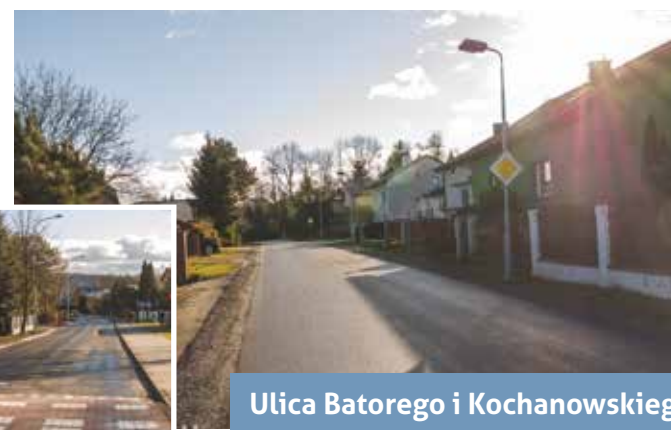
Ulica Batorego i Kochanowskiego