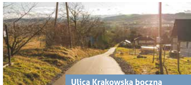
Ulica Krakowska boczna

Prace objęły m.in. profilowanie istniejącej nawierzchni, wykonanie poboczy z kruszywa łamanego i nowej nawierzchni z betonu asfaltowego.